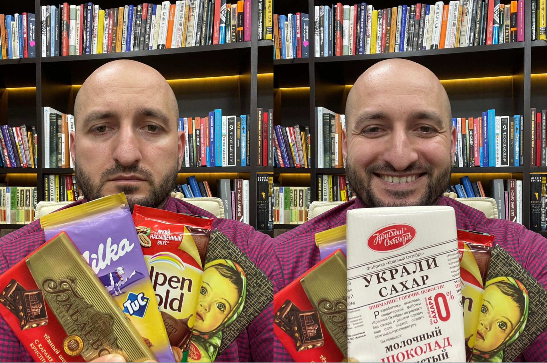
КЕЙС 4 Как остановить взгляд покупателя, Дж.Траут проходящего мимо полки (дизайн или название) ?